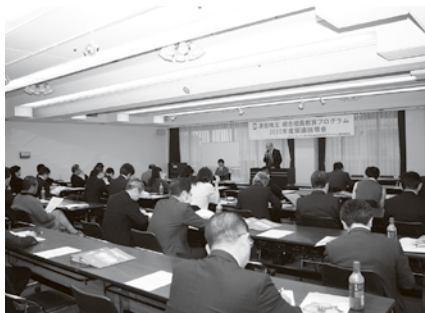
多くの参加者が集まった