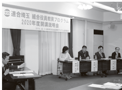
パネラーの皆さん