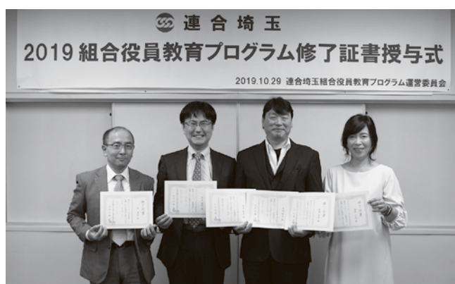
修了者のみなさん