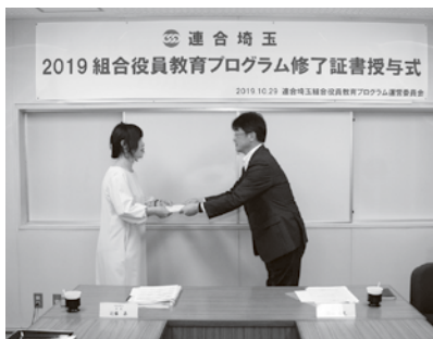
近藤会長から修了書を授与