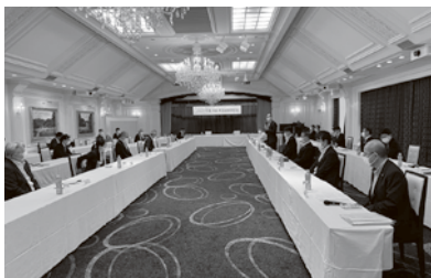
西部ブロック政策懇談会