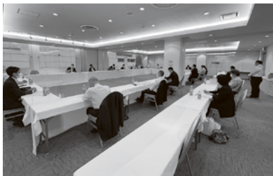
東部ブロック政策懇談会