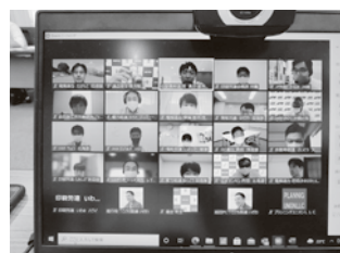
画面越しの参加者

心に秘めた想いを言葉で伝えることは難しいものですが、LEGOブロックでイメージを形作ることで、より明確化されるという新たな発見がありました。