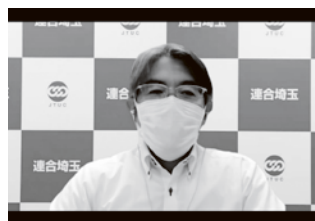
講師：柿沼副事務局長