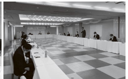
北部ブロック政策懇談会

「市長・町長政策懇談会」では、地協エリアに該当する市・町の推薦・友好首長(総勢24名)および推薦議員(総勢32名)が参加のもと、活発な意見交換がおこなわれました。