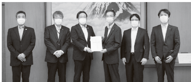
九都県市首脳会議座長への要請書提出