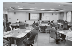
セミナーに参加した皆様