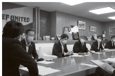
神谷 九都県市首脳会議座長との意見交換