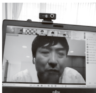
岡委員長による挨拶

開催にあたり、岡委員長より「ユースラリーをつうじ、構成組織の枠を超えた異業種間の交流を深め、新たなヒューマンネットワークを作ってほしい。また、テーマとして掲げた【組織のSDGs】については、ワークショップを楽しみながら学び、誰一人取り残さない社会の実現に向け、連帯の輪を広げる初めの一步として取り組んで頂きたい」と挨拶がありました。