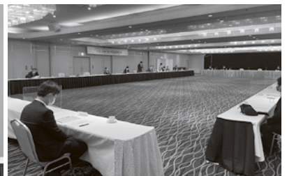
南部ブロック政策懇談会