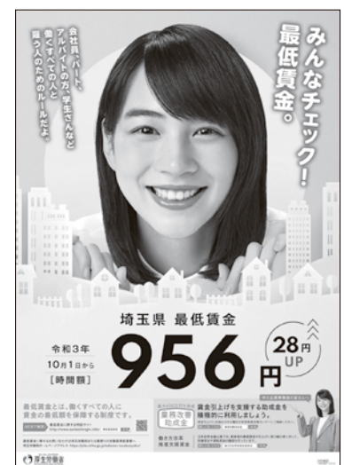
最低賃金ポスター

簡易計算サイト「チェック!あなたの賃金は、大丈夫?」 https://www.jtuc-rengo.or.jp/action/saiteichingin/