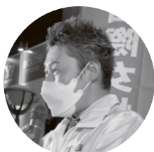
五十嵐執行委員 (情報労連)