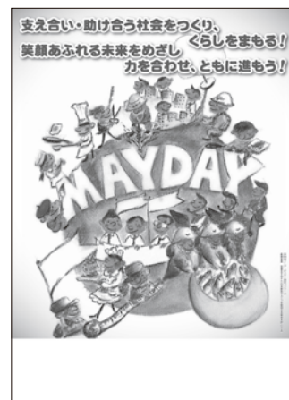
【第94回埼玉県中央メーデー&地域メーデーポスター】