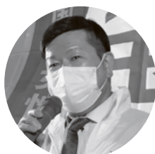
高場執行委員 (埼交連)