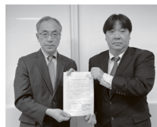
埼玉県経営者協会

そのためにも、価格転嫁は非常に重要でありす。価格転嫁が進んだとの声もあるが、そのすべてを転嫁はできていない状況にある」とコメントがありました。