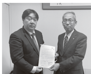
埼玉県商工会議所連絡会