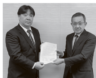
埼玉県商工会連合会