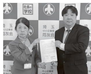
埼玉中小企業家同友会