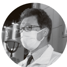
小嶋執行委員 (JAM埼玉)