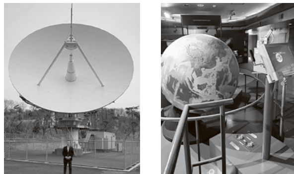
JAXA「地球観測センター」のパラボラアンテナ(筆者)と体験型の地球観測展示室

このような状況の中で、第20回統一地方選挙がおこなわれています。それぞれの地域で抱える課題をどのように解決していくのか?、それぞれの候補予定者の政策を確認しながら、その政策を実現できると思える人に投票して頂きたいと思います。