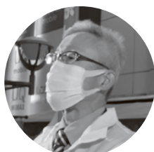
菊地執行委員 (基幹労連)