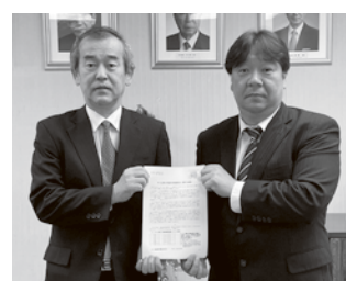
埼玉県中小企業団体中央会