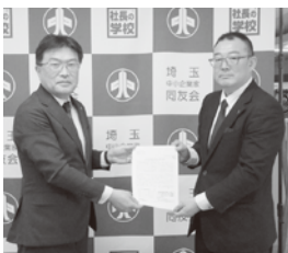
埼玉中小企業家同友会