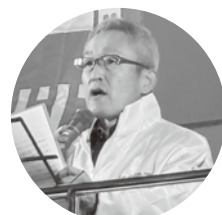
菊地執行委員(基幹労連)