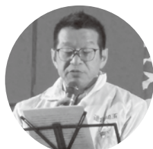
根岸執行委員(JAM埼玉)