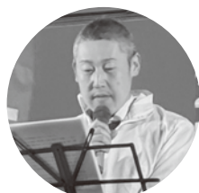
五十嵐執行委員(情報労連)