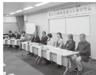
パネリストの皆さま