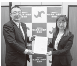
埼玉県商工会議所連絡会