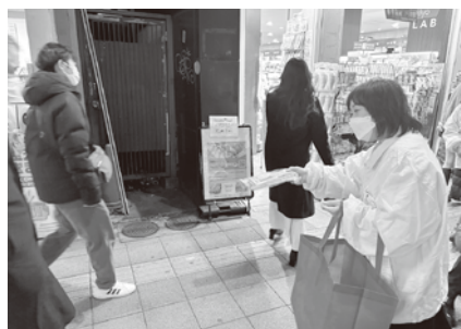
メラミンパンスポンジと チラシ入りティッシュを配布