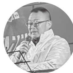
迫副会長(自動車総連)