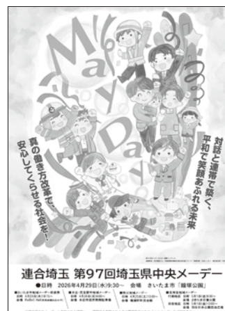
【第97回埼玉県中央メーデー&地域メーデーポスター】