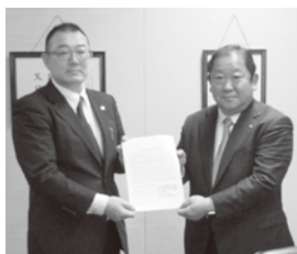
埼玉県商工会連合会