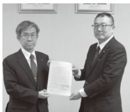
埼玉県中小企業団体中央会