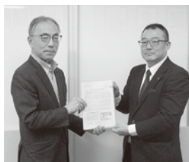
埼玉県経営者協会

(注意) ①この賃金は、男女同一です。 ②年齢は今年の4月1日現在の満年齢です。 ③設定額は、いずれも今年の4月分給与からです。 ④この金額は、時間外手当・休日出勤・交替手当・通勤手当を除き、毎月決まって支払われる定額内の賃金です。